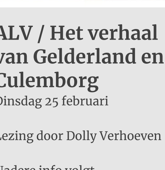
Foto: Mary Dresselhuys